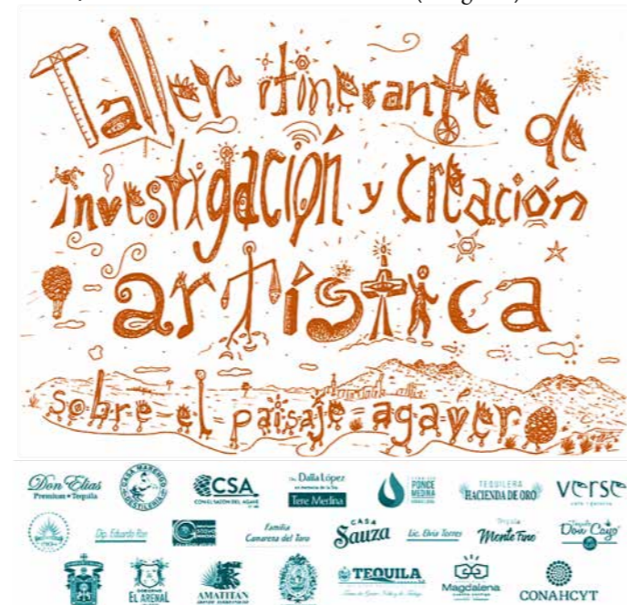
Imagen 2. Logotipos integrantes del TIICASPA

Tras dos años y medio de planificación, iniciamos los momentos complementarios de práctica y observación con la primera jornada del TIICASPA en la Escuela Lázaro Cárdenas de El Arenal, realizada el 24 de febrero de 2022 (Imagen 2).